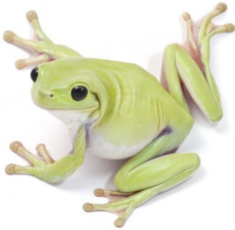
FROG / frog /