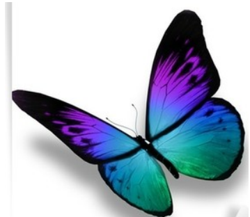
BUTTERFLY / baterflai /