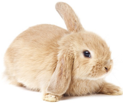
RABBIT / rabbit /