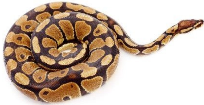
SNAKE / sneik /