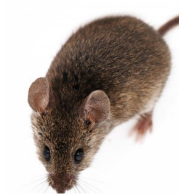
MOUSE / maus/