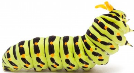
CATERPILLAR / Caterpillar /