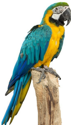
PARROT / parrot /