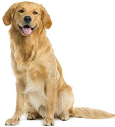
DOG / dog /