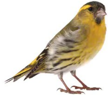
BIRD / berd /