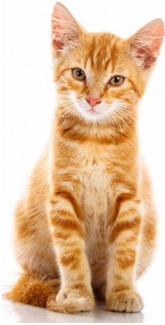
CAT / cat/